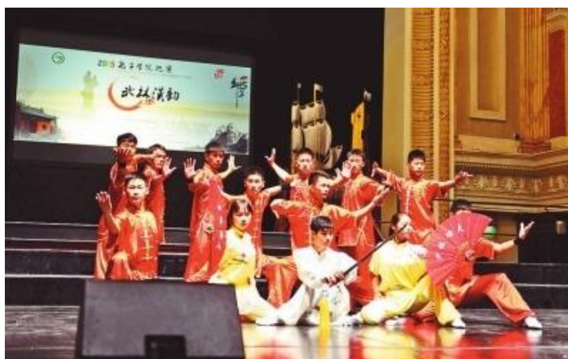
《武林汉韵》赴欧洲四国巡演